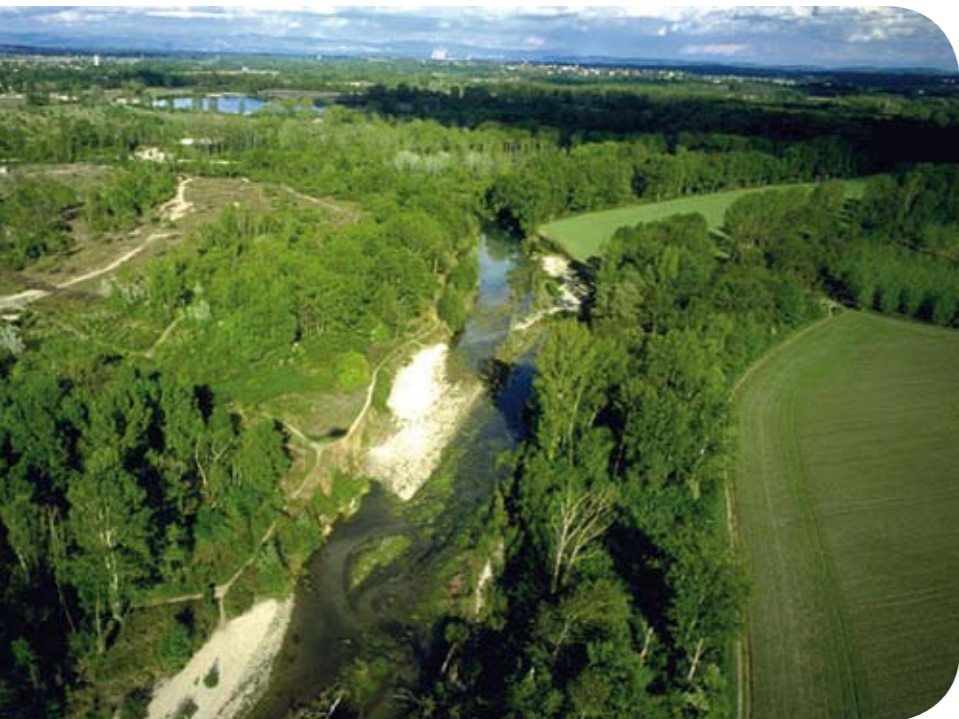
Mise en réseau des espaces naturels Par la localisation de l'armature verte et la définition d'un réseau de liaisons vertes et d'un réseau bleu (mise en valeur des fleuves, rivières et cours d'eau), le SCOT s'inscrit dans la logique de mise en réseau des espaces naturels telle que déclinée par la « trame verte et bleue » instaurée par la loi Grenelle de l'environnement.